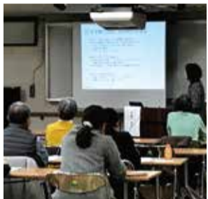
ユースプラザの専門相談員がお話します