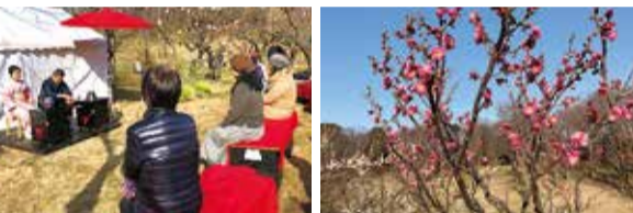
市内でも屈指の梅の名所を満喫しませんか