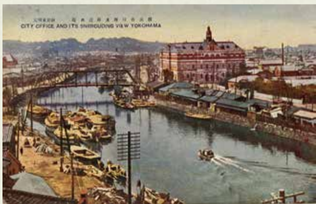
派大岡川と2代目横浜市庁舎 明治後期～大正期