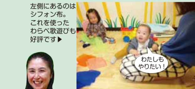
左側にあるのはシフォン布。これを使ったわらべ歌遊びも好評です▶