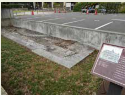
植栽帯に残る煉瓦基礎 2017年撮影