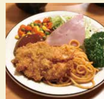
安くておいしい人気のBランチ。メインはハンバーグとチキンカツ

住所 日ノ出町1-20 電話 241-0696 営業時間 11時～14時30分 17時～19時 定休日 水曜