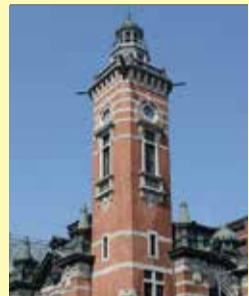
▲普段はのぼることができない塔にのぼるチャンス