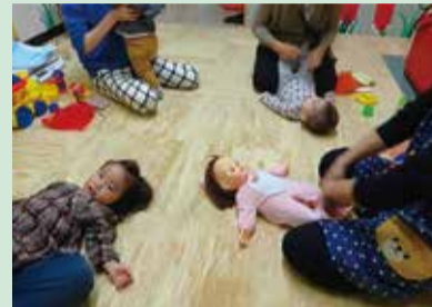
◀ベビーマッサージで、心と体の成長発達をお手伝い

この日はプレイルームの開放日。10時を過ぎ、親子が集まってくると、絵本の読み聞かせやベビーマッサージ、わらべうた遊びなどを楽しんでいました。「子供が遊ぶ遊びを提案してくれるので、家での過ごし方の参考になります。育児相談もできるいい場所です」と、利用者も笑顔でした。