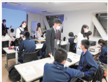
中学生の学習支援教室

Rainbowスペースは、小学生から大学生までの外国につながる若者の居場所です。国をまたぐ経験や葛藤・悩みをもつ若者たちに将来の可能性を広げてもらうため、人材育成につながる研修や体験、学習支援のほか、映画製作などの表現活動も行っています。