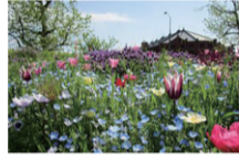
▲ヨコハマ花散歩HPより

花や緑あふれる美しい景観・自然豊かな横浜を再発見!それぞれガイドと共に巡ります。📅①3月29日(火)、②4月26日(火)※雨天時は①4月5日(火)、②5月3日(祝・火)10時～12時 集合場所:①新港中央広場(新港1-5)、②本牧山頂公園(和田山1-5)レストハウス 👤20人(先着) ¥1,000円 申3月11日(金)から電話・来館で