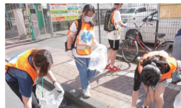
横浜中華街クリーンアップ

なかラウンジが架け橋となって、日本語教室などに参加している外国人住民を、まちの清掃活動や地域の花植えイベントなどの参加につなげています。