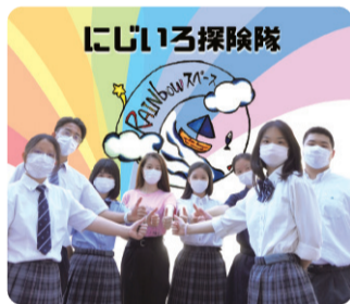
にじioru探険隊のメンバー