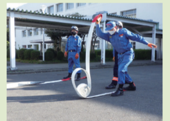
ホースは水が入っていないとても重い!ロープ、チェーンソーを使った訓練も。

—15歳のときに中国・福建省から初めて来日しました。19歳から23年間日本で生活しています。友だちをつくるのは得意で、話をしているうちに自然と日本語を覚えました。子どもの頃から総合格闘技を習い、体を鍛えることが好きで、250回の腕立て伏せは寝る前の日課。腕相撲は負けたことがありません!もともと消防士に憧れていて、仕事の関係で消防署とつながりがあったこともあり、自ら入団を申し出ました。訓練は主に土日の午前中で、月1・2回の頻度で参加しています。年末年始の特別警戒にもあたりました。資機材は見たことがないものも多く、取り扱い方法を覚えるのに時間がかかり大変です。自分たちで街を守るという消防団の概念は、日本独特なのではないかと思っています。まずは知識を身につけ、家族や近くにいる人を守りたい。災害はないほうが良いけれど、何かあった時には、自分が人を助けたいと思っています。一人前になるには通常1～2年かかりますが、早く一人前になって、人の役に立ちたいです。4人の子どもたちは、自分もなりたいて言ってくれています。将来、消防士や消防団員になるのであれば、大賛成ですね!故郷に帰る予定は今のところありません。日本での生活が当たり前になっていて、中華街は地元みたいなもの。中国語を話す人が多い中区での消防団活動では中国語と日本語を生かしていきたいですね。「来なくていい」と言われるまで行きますよ!