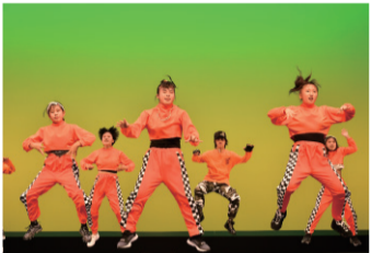
関内ホール・大ホールで踊ろう!

📎 400人(区内在住・在勤・在学、先着) 💰 ①10人以上は1人1,500円(高校生以下800円)、②10人未満は1団体15,000円(全員高校生以下8,000円・混在する場合は要問い合わせ) 申 3月11日(金)～4月10日(日)に電話・FAX・Eメール(団体名・代表者名・ダンスジャンル・参加人数・〒・☎)を記入) ※本番は7月31日(日)①13時～/主に子ども、②18時～/主に大人 関内ホール 大ホールで