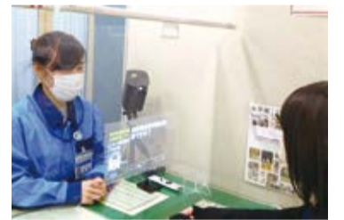
窓口字幕システム