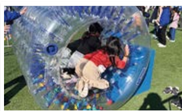
横浜スタジアムでのイベントに参加したよ!