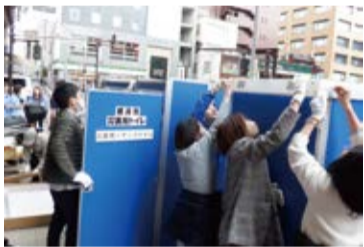
防災訓練 (災害用トイレの設置)