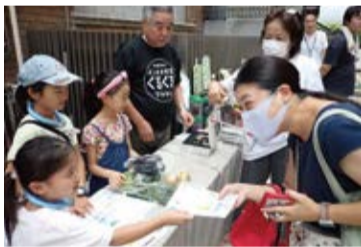
なかくっこ自由研究大作戦 (野菜の販売体験)