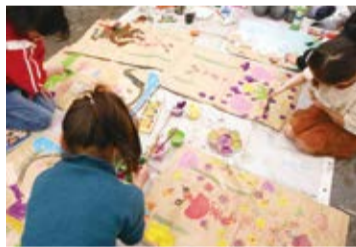
多文化共生交流イベント