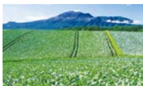
▲一面に広がるキャベツ畑と浅間山