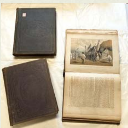
▲写真1 『日本遠征記』(上院版) 横浜開港資料館蔵