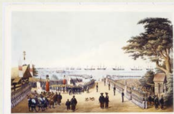
▲写真2 「ペリー提督・横浜上陸図」(ハイネ原画・石版画) 横浜開港資料館蔵