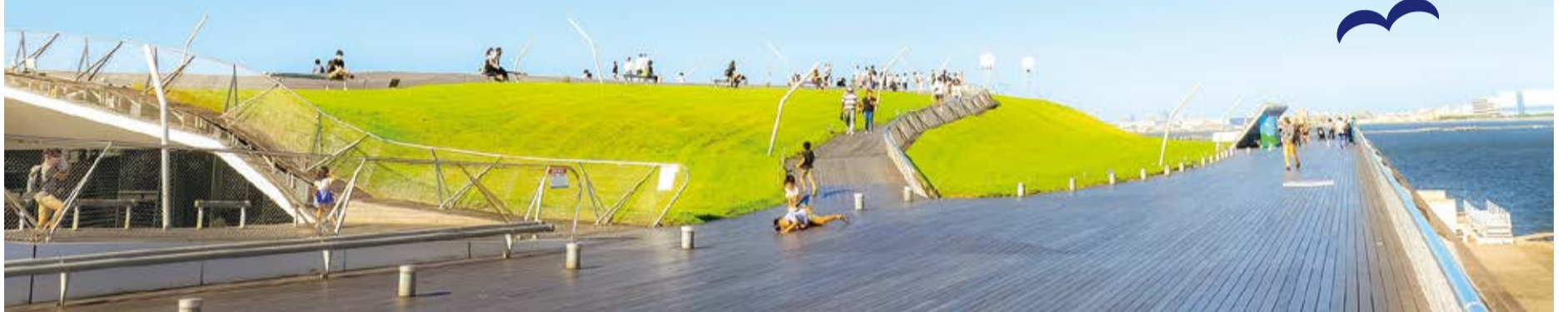
▲中区って「イイネ!」フォトコンテスト2023 一般部門入賞作品