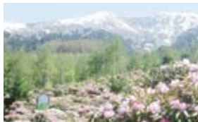
▲浅間高原シャクナゲ園