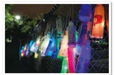
ペットボトルライト、きれいに作れたよ!