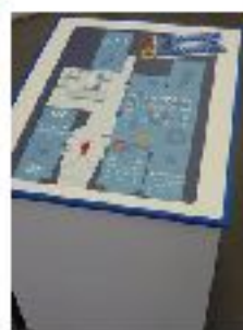
センター入口の案内ボード→