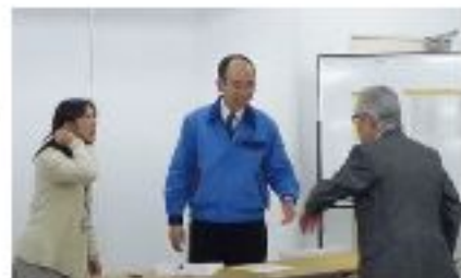
公開抽選会の様子

22年度ロッカー希望者の抽選会が行われました。ロッカーは1年単位での使用となりますが今年の使用希望者は37団体であり、抽選で24団体を決定しました。なおロッカーケースはまだ空きがあり、ロッカー使用団体以外でご希望の場合は、申込みが可能です。