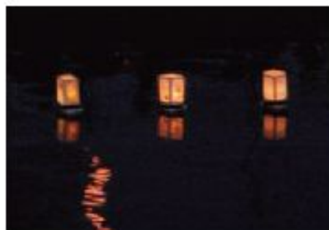
大岡川を流れる灯籠