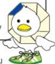
なか区民活動センターマスコット「もなか」

なか区民活動センター ホームページ http://www.city.yokohama.lg.jp/naka/ncac/