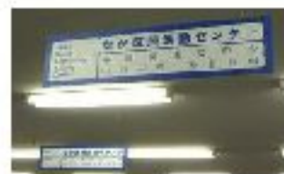
↑多言語表示の吊り看板

なか区民活動センター入口に案内ボードができました。また、ミーティングエリア内の上部にサインを吊り下げ、初めて来た人にも各コーナーの位置がわかるようにしました。さらに、リーフレットもフルカラーの新しいデザインに変わりました。プチ・リニューアルした、なか区民活動センターをこれからもよろしくお願いたします！