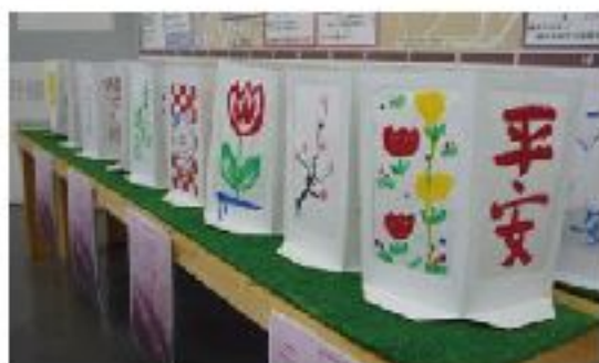
日本語ひろば参加者の皆さんが描いた灯籠

「日本語ひろば」では、毎週火曜日に日本語学習をしていますが、この日は日本の文化の一つである灯籠づくりに挑戦しました。灯籠の面に絵や文字を描いてみました。数日経過後の4月4日夜、これらの灯籠は、今年の“大岡川桜祭り”で川面を彩りました。