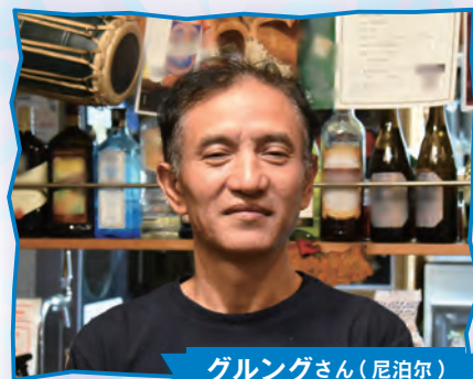
グルングさん(尼泊尔)