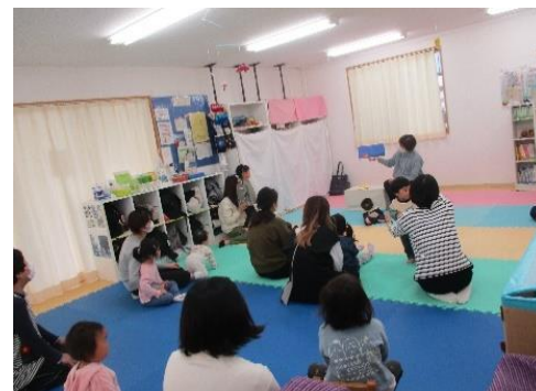
“おはなし会” わらべうたでふれあい遊びも。

【お問い合わせ・お申込み】 横浜市南浅間保育園 (西区育児支援センター園) 横浜市西区南浅間町23-3 ☎045-312-0942