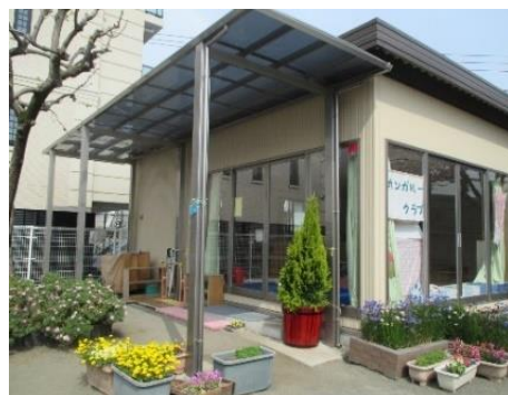
園庭の一角にある支援室 “カンガルーむ”