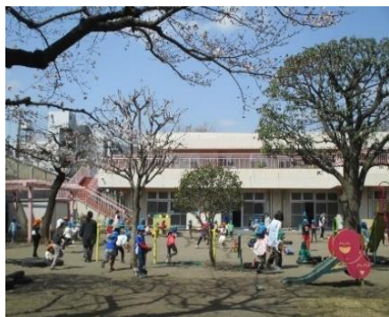
園庭でたくさん遊べます。