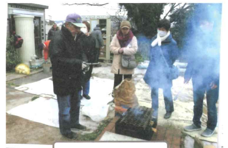
防災広場で、麦茶をふるまう