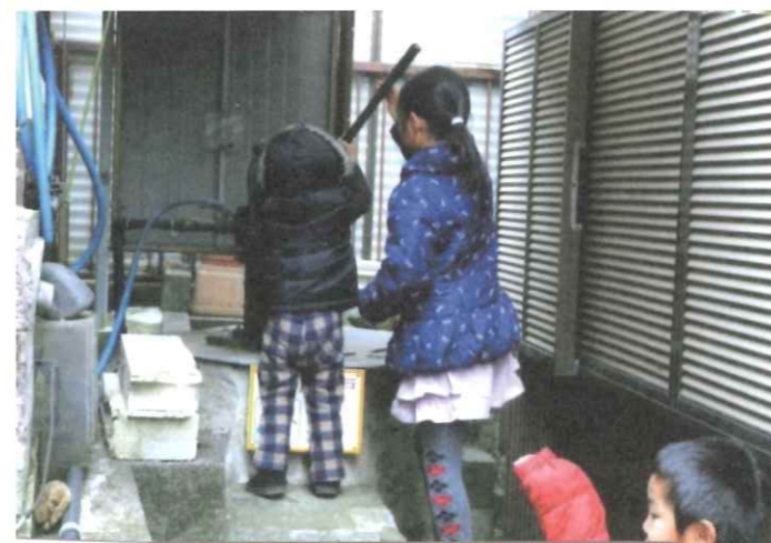
防災井戸を子供たちが、動かしている。