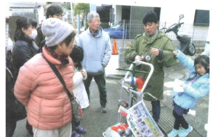
スタンドパイプの使い方の指導を受けている。