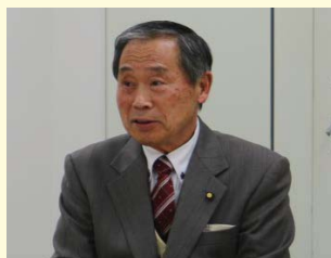
<瀬谷区上瀬谷通信施設返還対策協議会 網代会長>

冒頭、網代会長から「上瀬谷のまちづくりは、瀬谷の発展に向けて区民の期待が高く、地権者の方々の夢や希望を叶えていくことが大切」といったお話がありました。