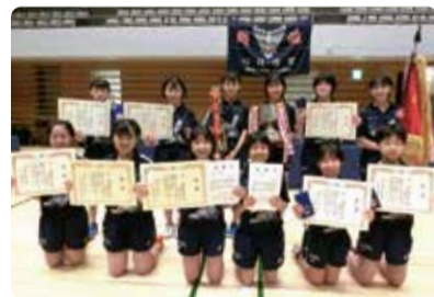
横浜隼人中学・高等学校 中学女子卓球部

私たち卓球部は、団体戦での雰囲気がとても良く、どの学校よりも明るく元気に声掛けを行っています。みんなで一体になって試合に挑む姿勢は、部の伝統でもあります。普段は高校生と一緒に活動しています。上下関係がある中でもみんなが仲良く、チームが良くなるように意識を高め合いながら、練習しています。今後は、悲願の全国優勝に向けて、日々努力を積み重ねていきたいです。