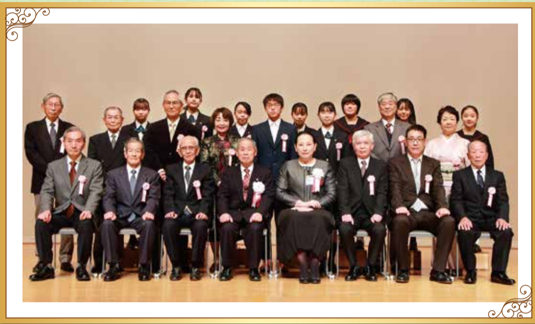
※撮影時にマスクを外しました。

福祉、保健、環境保全、街づくり、自治会町内会運営、文化、スポーツ、学術、防犯・防災その他の分野において、功績のあった皆さんを令和4年瀬谷区新年祝賀会(1月5日)の中で、区長から顕彰しました。