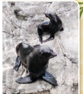
メスより大きいオス(体長約2倍、体重約4倍)

繁殖期には沿岸の岩場を埋め尽くすほどのオットセイが集結し、オス同士が飲まず食わずで戦います。勝ち抜いたオスがメスと交尾できるため、オスの体がここまで大きくなったと考えられています。