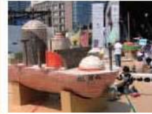
⑤大さん橋会場・赤レンガ会場（1号館）