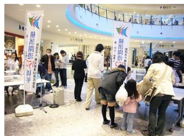
■ポスター 横浜駅みなみ通路