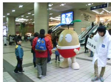
■キャンペーンセット