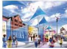
④赤レンガ会場（広場）