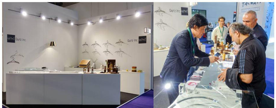
【国際見本市「アンビエンテ」出展の様子】