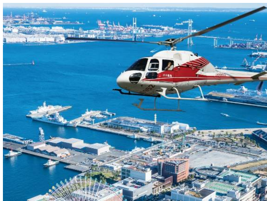
【ヘリコプター体験】