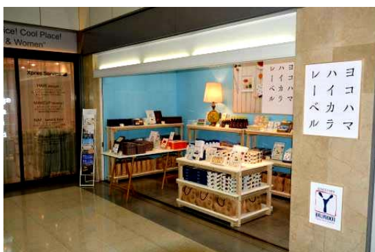
【羽田空港ショップ外観】