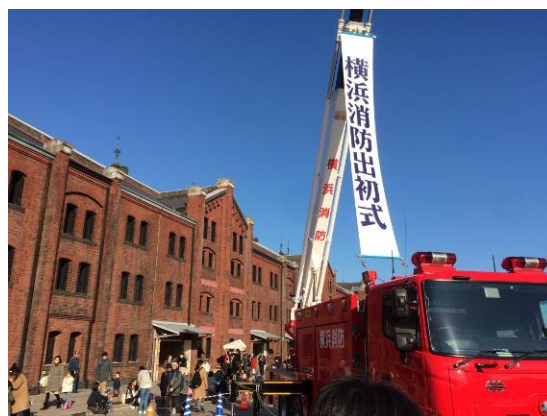
【消防出初式見学ツアー】