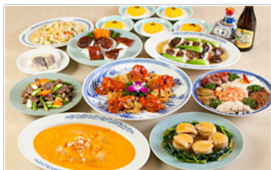
【中華街名店チョイスプラン】