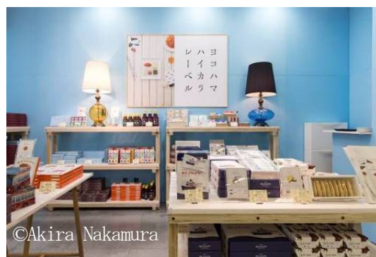
【羽田空港ショップ内観】