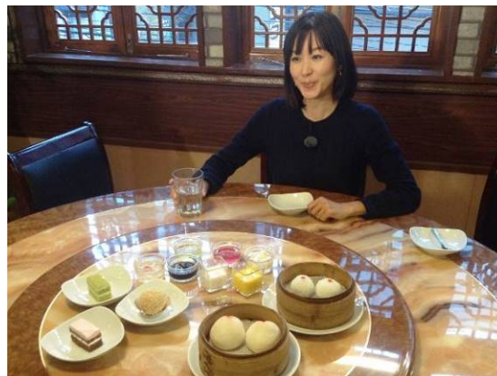
【北京ダック専門店（t v k 『ハマナビ』取材）】