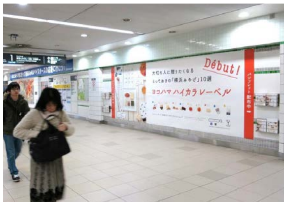
【みなとみらい線横浜駅大型ポスター】