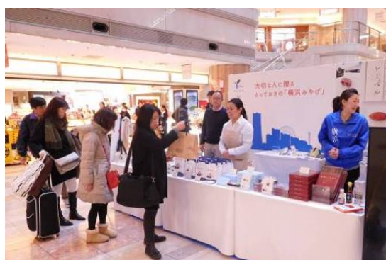
【物販コーナーの様子】