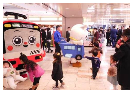
【キャラクターによるイベントの様子】