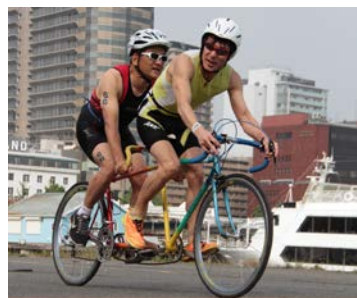
【エイジ パラトライアスロン】