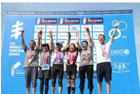
【エイジ (一般) の部 表彰式】