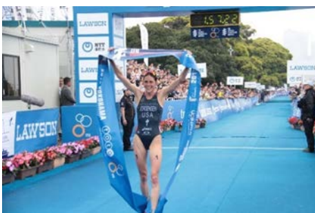
【エリート女子フィニッシュ】