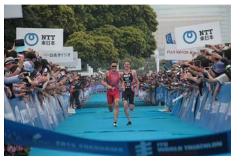
【エリート男子フィニッシュ】