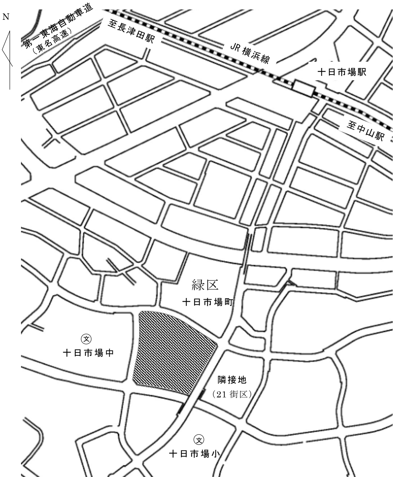
(参考) 処分予定地 位置図