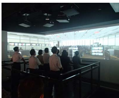
【市民防災センターの体験】