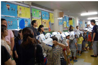
【保護者と一緒に避難訓練】