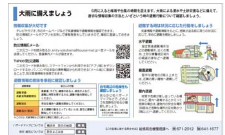
(広報よこはま 平成30年6月号)