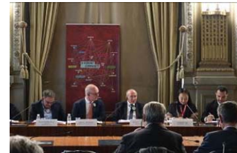
絹の都市国際ネットワーク 調印式（11月21日）