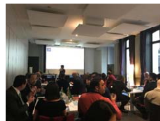
絹の都市国際ネットワーク 実務者ミーティング （11月22日）