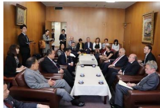
横浜市会との意見交換 （5月22日）