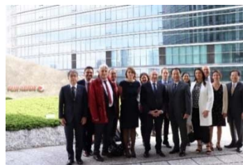
富士ゼロックス㈱ 横浜みなとみらい事業所視察 （5月22日）