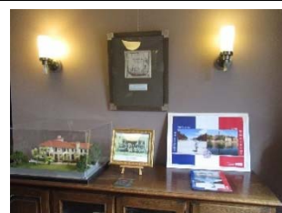
世界のクリスマス（12月）