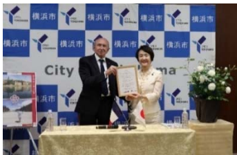
横浜市庁舎でのバラ 受贈式（5月22日）