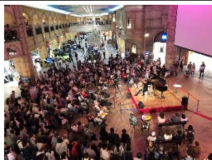
トレッサ横浜フランス月間（7月）