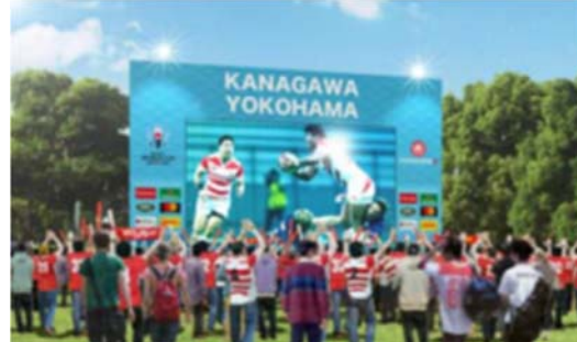
開催都市最大級の大型スクリーン（イメージ）