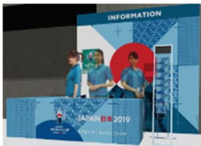
案内デスクイメージ