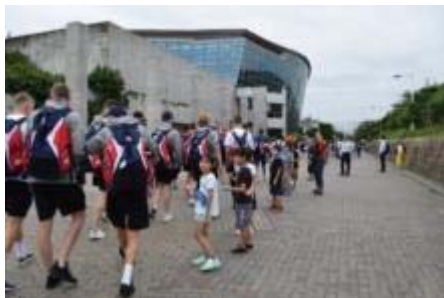
① 歓迎セレブレーション