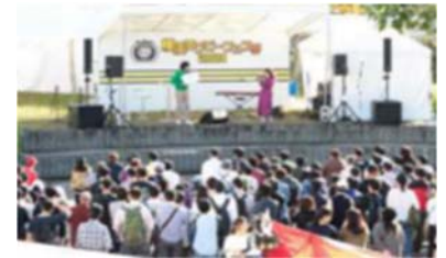
昨年度のブレディスローカップでの周辺イベント

試合開催日は、国内外から訪れる観戦客をおもてなしするため、新横浜駅前公園でラグビーイベント「横浜ラグビーフェスティバル 2019」を開催します。