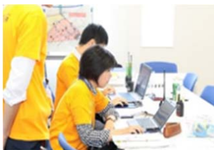
開催都市大会運営本部

ホスピタリティ施設や、記者席・実況席の増設等の仮設整備を実施し、9月11日から組織委員会へ会場を提供しています。