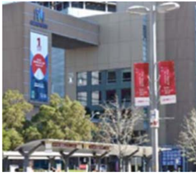
昨年度のシティドレッシングの様子