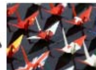
参加国国旗折り鶴