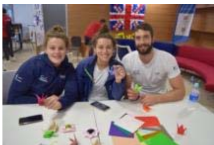
③ 日本文化体験プログラム