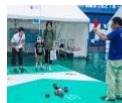
パートナーブース