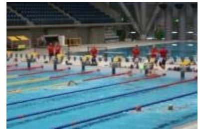
英国水泳代表チームの練習風景