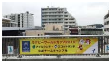
キャンプ地をPRする横断幕

また、キャンプ地のPRとして、金沢区内において横断幕や懸垂幕の設置やパブリックビューイングを実施しました。