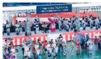
全18区が参加した大盆踊り大会