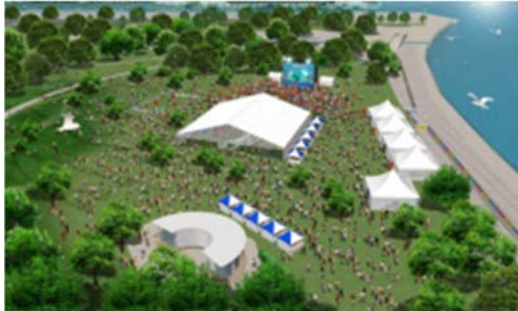
海と芝生の開放的な空間が特徴の臨港パーク

大会の試合映像を楽しめるパブリックビューイングのほか、ステージイベントや飲食スペースなど、市民・県民のみならず、国内外から訪れる多くの方に楽しんでいただける魅力的な空間を創出してまいります。