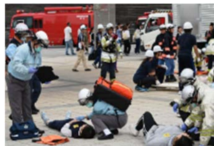
横浜国際総合競技場での テロ対策訓練