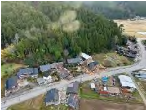
①倒壊家屋の状況（輪島市内）