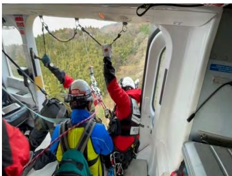
⑤他都市隊員の孤立地域への投入状況 （輪島市西二又町 にしふたまたまち ）