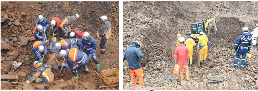
③土砂災害での救助活動(輪島市 なふねまち 名舟町)