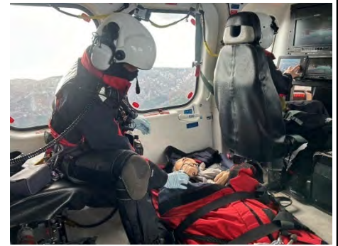
④傷病者搬送の状況