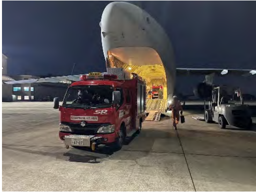
①自衛隊輸送機による震災救助隊の派遣 (埼玉県 入間基地)