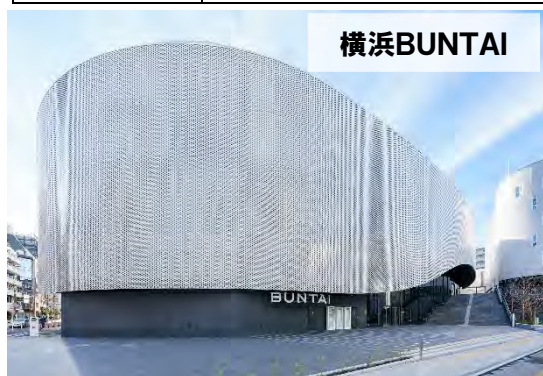
※2024年(令和6年)4月開館(予定)