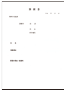
*なるべくA4判にしてください。 (なお、市会ホームページから書式をダウンロードすることができます。)

※陳情の内容によっては、委員会での審査や市長等からの回答を求めない取扱いとすることがありますので、ご注意ください。