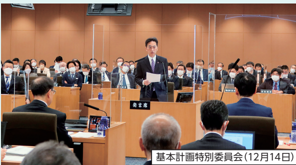
基本計画特別委員会(12月14日)

住民に最も身近で幅広い施策に取り組む「基礎自治体」。その議事機関である横浜市会は、市民の多様な意見に寄り添い、議論を通じて、市民生活の向上・発展に向けて取り組んでいます。その役割等を数字で紹介します。