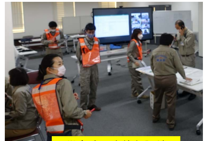
災害時医療体制訓練