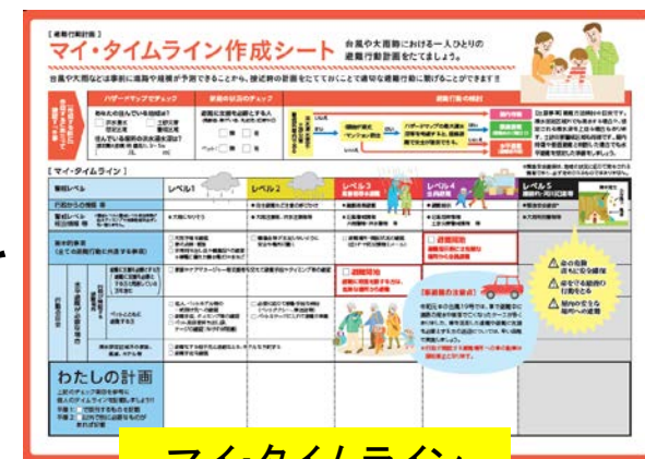
マイ・タイムライン作成シート

・学校と連携し、特に中学生の防災意識を高めるための防災教育を推進【新規】 (生徒、教職員向け出前講座の実施)