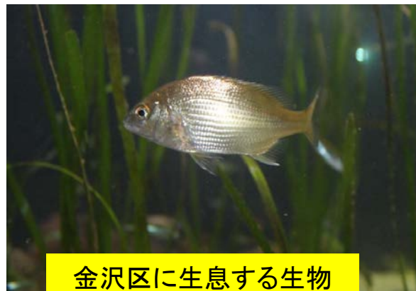
金沢区に生息する生物 (クロダイ)