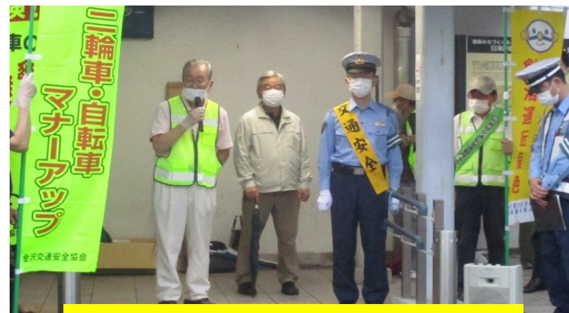
夏の駅頭キャンペーン(京急富岡駅)