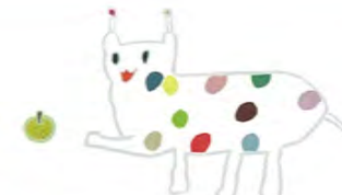
戸塚区のマスコット ウナシー

発行日 平成 25 年 3 月 25 日 発行者 戸塚区消費生活推進員 広報編集委員会 事務局 戸塚区役所地域振興課 電話 045-866-8416