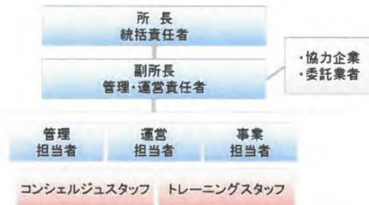
鶴見スポーツセンター管理運営体制図