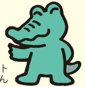
鶴見区のマスコット ワックン