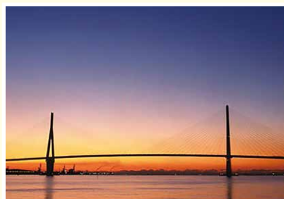
海のまち「鶴見つばさ橋」