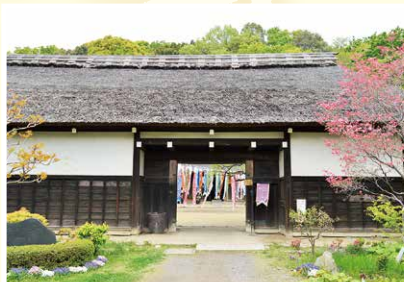
丘のまち「横溝屋敷」