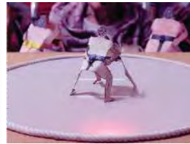
トントンボイス相撲