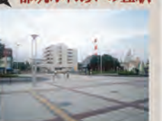
Q 都筑ふれあいの丘駅

2008年にグリーンラインの開通によりオープンした駅です。駅名は、近傍の清掃工場の余熱を利用した地区センター、老人福祉センター、プールなどが集積するエリア「都筑ふれあいの丘」に由来します。