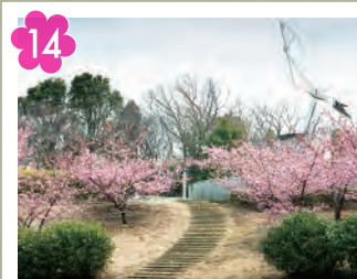
茅ヶ崎公園の河津桜