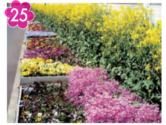
25 美里橋 花かおる街かど花だん 場所：東山田四丁目 美里橋周辺