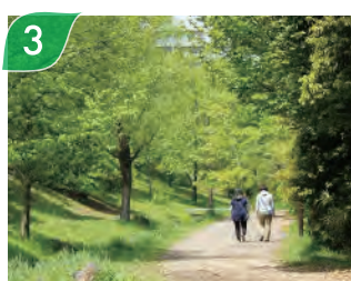
新緑のくさぶえのみち