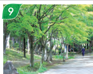
新緑のささぶねのみち