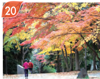
20 晩秋のささぶねのみち 場所：茅ヶ崎公園～葛ヶ谷公園～ 鴨池公園～都筑中央公園周辺