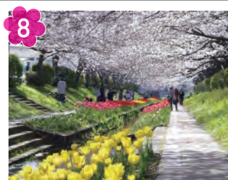
江川せせらぎ緑道の 桜とチューリップ