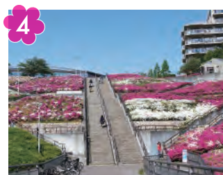
横浜国際プール前のツツジ