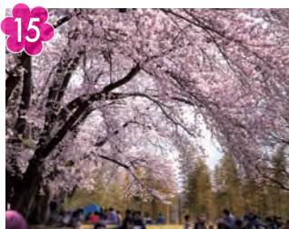
15 中川八幡山公園の桜 場所：中川八幡山公園 (中川七丁目13)