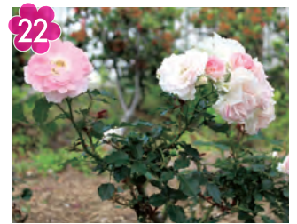
22 都筑中央公園の 「ローザ・つづきく」 場所：都筑中央公園(荻田東四丁目11)