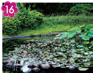
16 山田富士公園の 桜・スイレン・ハスの花 場所：山田富士公園(北山田一丁目4)