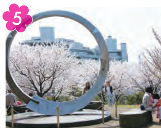
都筑中央公園の桜と 港北ニュータウン建設事業記念碑