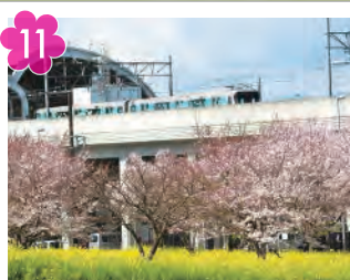
川和町駅近くの 菜の花と桜