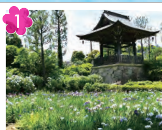
正覚寺の 花菖蒲とあじさい