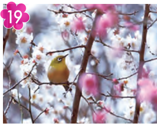
19 山田富士公園の梅林 場所：山田富士公園 (北山田一丁目4)