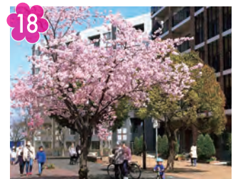
18 都筑ふれあいの丘駅周辺の サクラ並木 場所：都筑ふれあいの丘駅周辺