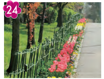
24 準工地域フラワーロード 場所：東山田四丁目 観音寺前 約450m