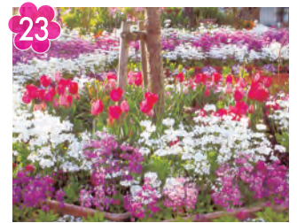
23 えだきん商店街遊歩道 場所：えだきん商店街 (荻田南5丁目)