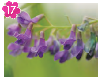
17 柚木台のオオバクサフジ 場所：荻田南町