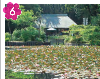
せせらぎ公園の 古民家と睡蓮