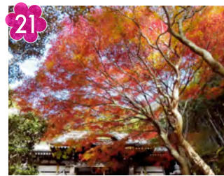
21 心行寺の紅葉とアジサイ 場所：心行寺 (荻田東四丁目10-1)