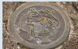
うさぎのレリーフ

月出松公園では、広場の地面中央のうさぎのレリーフを中心として、それを囲むように中国の神話で、天の四方を司る霊獣である四神(青竜、朱雀、白虎、玄武)の4枚のレリーフが配置されている。