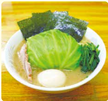
キャベ玉ラーメン 850円

丼ぶり中央に大きなキャベツを使う「キャベ玉ラーメン」は、1/4玉のキャベツがごろっと入っており、とてもインパクトがあります。キャベツは、注文が入ってから、麺と同時に茹ではじめるため、熱々のまま提供され、ほんのり芯の硬さを残す茹で加減は、周りの具材と合わせて食感が楽しめます。また、地元、都筑で採れた新鮮さという特徴からキャベツは甘みがたっぷり、人気 No.1のラーメンとなっています!!