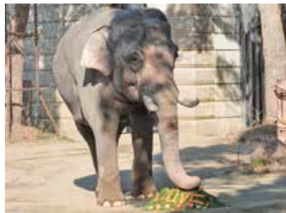
画像は去年の様子