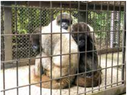
運動場に出る練習中