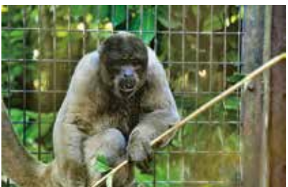
オスのセイロン。葉っぱが大好き!

子どものゴリラに間違えられるほど、筋肉質なウーリーモンキーですが、とてもかわいらしい声をしています。ぜひ、会いに来てくださいね。